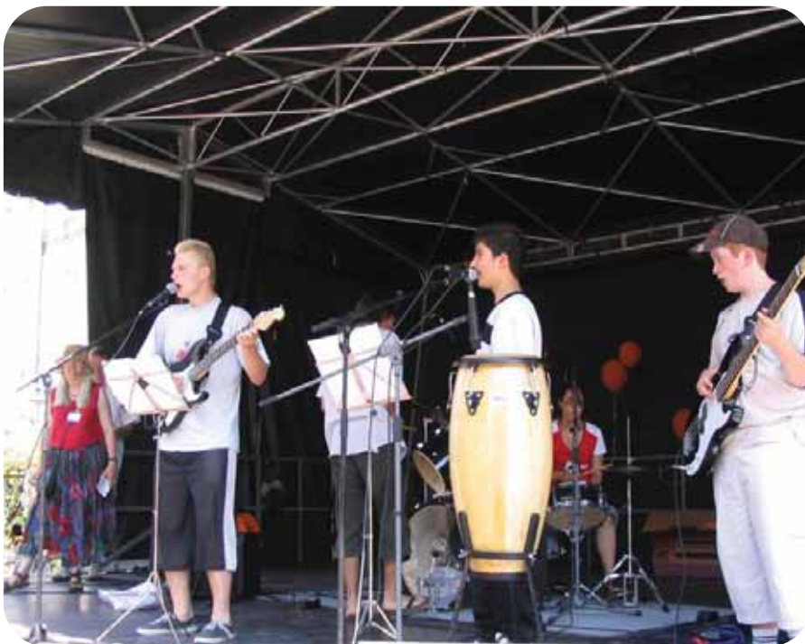
Die Schulband „The six rockers“ rockte auf der Bühne beim 8.Selbsthilfegruppentag in der Augsburger Maxstraße trotz großer Hitze was das Zeug hielt.

Das Referat für Umwelt, Verbraucherschutz und Gesundheit führte gemeinsam mit der Kontaktstelle für Selbsthilfegruppen in der Maximilianstraße seinen 8. Selbsthilfegruppentag durch. Zahlreiche Gruppen und Elterninitiativen waren auch diesmal vertreten und präsentierten sich und ihre Ziele. Auch die Lebenshilfe Augsburg, der Trägerverein der Königsbrunner Brunnenschule, demonstrierte mit seinen beiden Programmpunkten anschaulich, zu was für bemerkens-