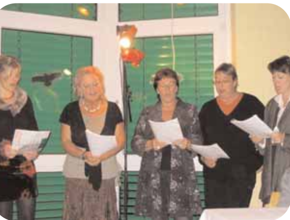
Der MitarbeiterInnen-Chor von Schule und Tagesstätte emtete wieder großen Applaus