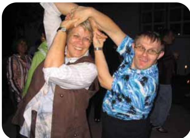
Nach den offiziellen Einlagen durften auch die Gäste nach Herzenslust zu den flotten Klängen aus der hauseigenen Diskothek im Garten tanzen.