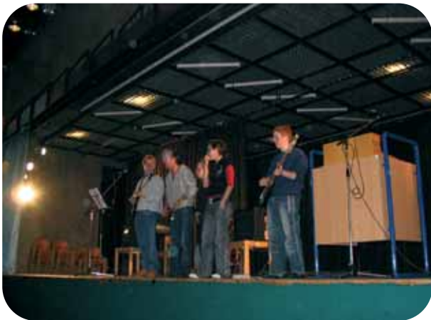
Schulband des Königsbrunner Förderzentrums Brunnenschule für Schüler mit besonderem geistigen Förderbedarf der Lebenshilfe Augsburg beim Aktionstag der Fachoberschule-Berufsoberschule Augsburg kurz vor Weihnachten 2005.

Das Förderzentrum Brunnenschule der Lebenshilfe Augsburg e.V., die Aids-Hilfe Augsburg und die Organisation „Ärzte ohne Grenzen“, dürfen sich auch 2006 wieder gemeinsam über eine großzügige Zuwendung aus den vorweihnachtlichen Aktionstageinnahmen der Fachoberschule - Berufsoberschule freuen. Jede der drei Organisationen erhielt diesmal 2300 Euro für ihre Arbeit zum speziellen Wohl derer Menschen, denen das Schicksal im Leben viel Mühsames beschert hat. Teilweise befinden sich diese Mitmenschen in Notlagen, wie beispielsweise die, durch eine Naturkatastrophe obdachlos geworde-