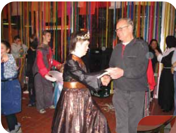
Buntes Faschingstreiben rund um das Thema „Baustelle“

Auch im Fasching 2006 organisierten Pädagogen des Königsbrunner Förderschulzentrums Brunnenschule der Lebenshilfe Augsburg, gemeinsam mit Schülern eine ihrer traditionellen, flotten Faschingsfeiern in der Aula der Schule. Zahlreiche Jugendliche, unter ihnen