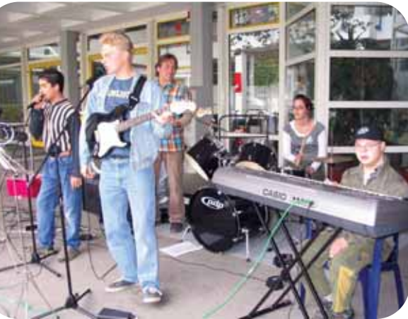
Großen Applaus bekam die neugegründete Schulband „Five rockers“ für ihren Auftritt beim Sommerfest der Lebenshilfe in Königsbrunn.

Fröhliches Miteinander bei Musik und Mitmach-Aktivitäten