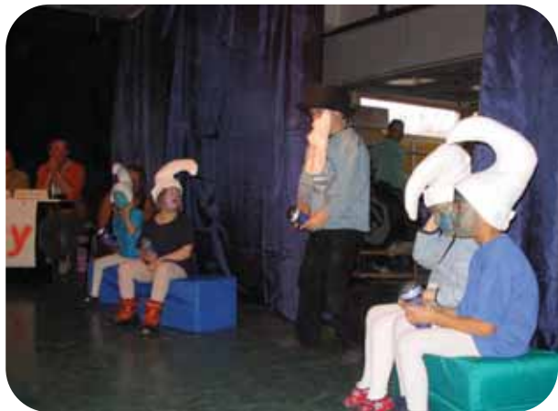
Mini Playback-Show von Schülern mit erhöhtem geistigen Förderbedarf der heilpädagogischen Tagesstätte der Lebenshilfe Augsburg, im Gymnastikraum des Königsbrunner Förderzentrums Brunnenschule.

Förderzentrum Brunnenschule wird zur Bühne für junge Karaoke-Talente