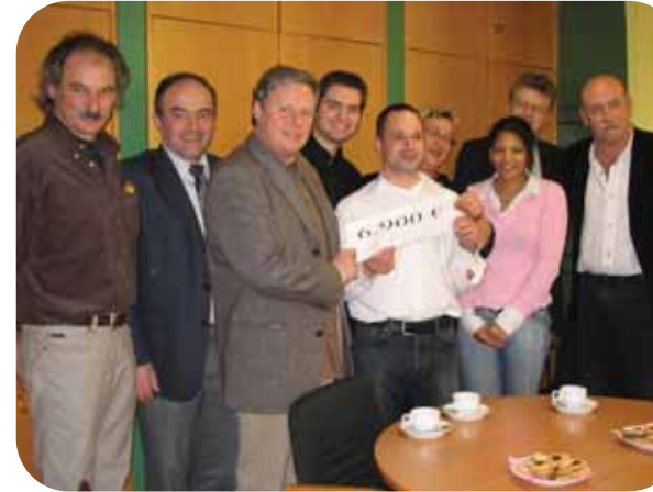
VL.Zur Spendenübergabe trafen sich an der FOS-BOS: