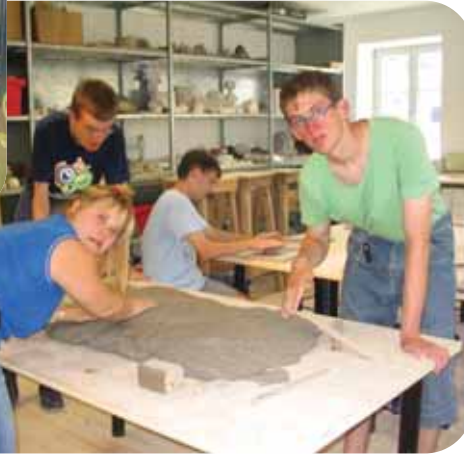
Schüler beim aktiven, künstlerischen Arbeiten und bei der 15-minütigen Pause im gemütlichen Cafe-Stübel der Kunstpension Bachern.

Streichen nicht nur die feinmotorischen Fähigkeiten der Schüler geschult, sondern auch das Bewusstsein für dieses Arbeitsmaterial geschaf-